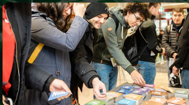
Studienrichtungssticker für Studierende & FirmenvertreterInnen