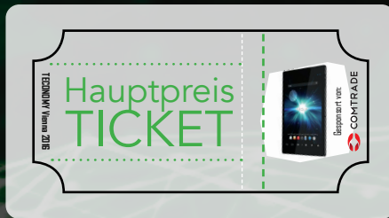
Hauptpreisticket TECONOMY Vienna 2016

Spenden Sie einen Hauptpreis und wir positionieren Ihr Logo im Zusammenhang mit unserem Gewinnspiel im Katalog, Online, sowie in weiteren ausgewählten Druckmedien.